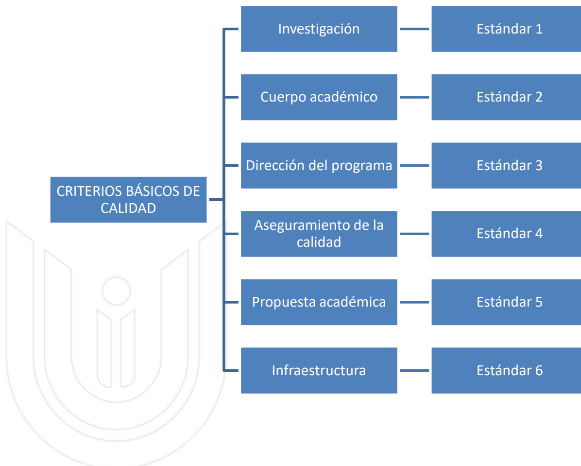
Gráfico 2. Criterios básicos de calidad para la aprobación de Doctorados

Los criterios y estándares de calidad deberán estar articulados con el proceso que desarrolla el Consejo de Educación Superior (CES) en la aprobación de programas de doctorado, como lo determina el artículo 169, literal f) de la LOES.