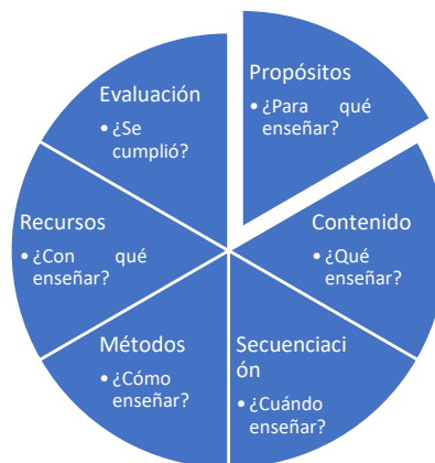
Figura 2 Elementos de un currículo

Una vez terminada la revisión de los elementos de análisis, los delegados determinan los componentes, subcomponentes y temas. Para ello, es necesario relacionar los resultados del aprendizaje con los elementos del currículo definido por cada programa. En la figura 2 se muestran los elementos de un currículo que permiten relacionar los contenidos de un programa que inician con los propósitos. (Guerra, 2011)